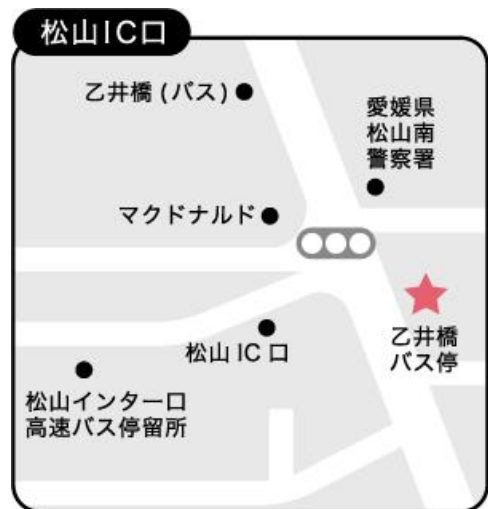
(伊予鉄バス 乙井橋バス停)