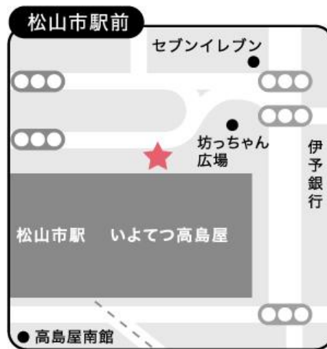
(松山市駅坊っちゃん広場前)