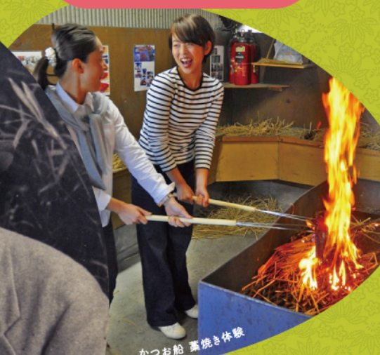
かつお船 薫焼き体験