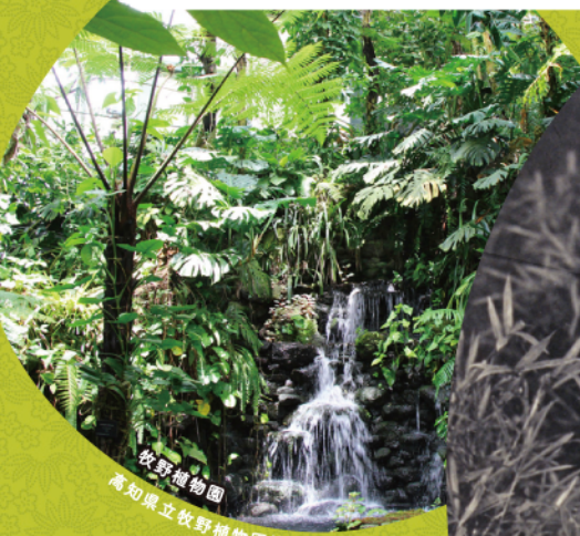
牧野植物園