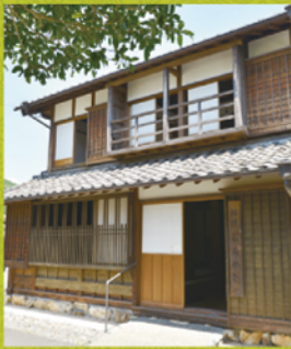
伊藤蘭林の寺子屋

牧野博士の人生を導き、佐川の教育の礎を築いたと言われている偉大な教育者、伊藤蘭林の寺子屋（私塾）が復元されています。