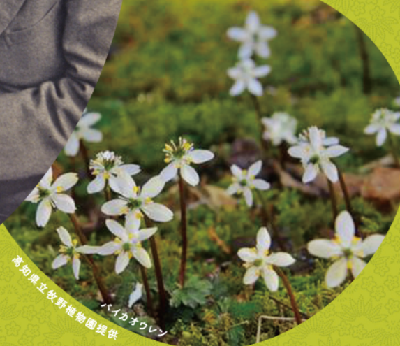
パイカオウレン

●日帰り ●添乗員：同行 ●最少催行人員：30名 ●食事：朝なし / 昼1回 / 夕なし ●利用予定バス会社：いずみ観光